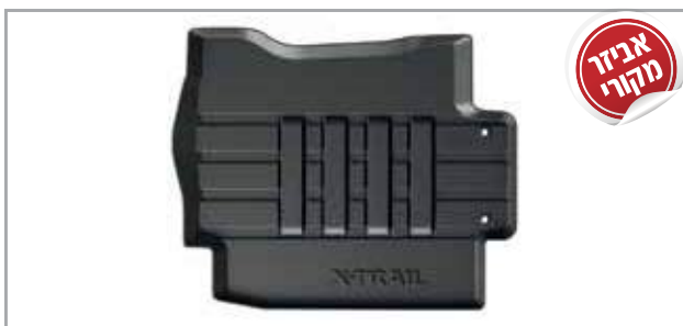
שטיחי גומי מק"ט: LP00021604