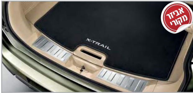
מדרך סף דלת תא מטען מק"ט: LP00021907