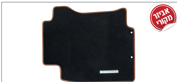
שטיחי לבד מהודרים בגימור חום מק"ט: LP-00021905