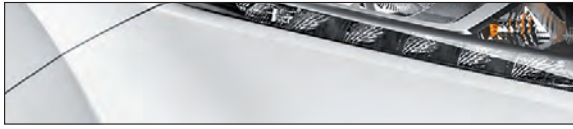
QAB לבן פנינה מטאלי