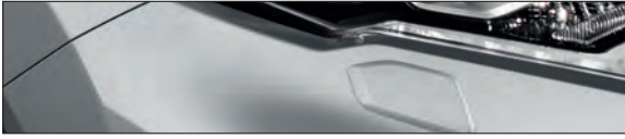
K23 כסף מטאלי