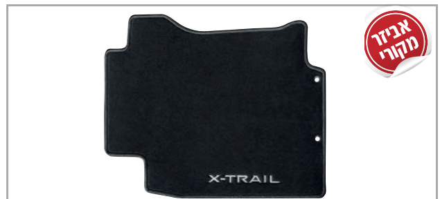
שטיחי לבד מהודרים מק"ט: LP00021904