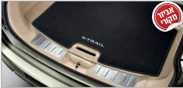
מדרך סף דלת תא מטען מק"ט: LP00021907