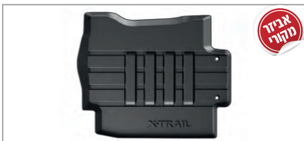
שטיחי גומי מק"ט: LP00021604