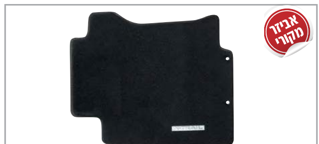
שטיחי לבד מהודרים בגימור שחור מק"ט: LP-00021906