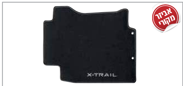
שטיחי לבד מהודרים מק"ט: LP00021904