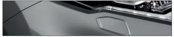
KAD אפור מטאלי