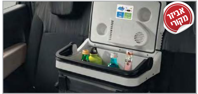
קירורית מק"ט: LP00011541