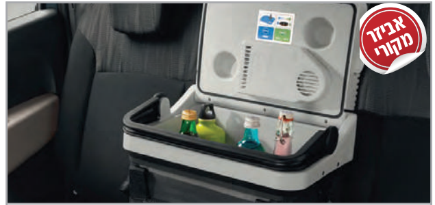
קירורית מק"ט: LP00011541