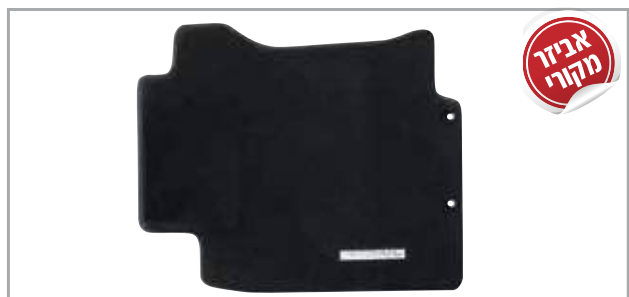
שטיחי לבד מהודרים בגימור שחור מק"ט: LP-00021906