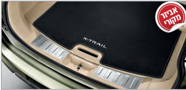
מדרך סף דלת תא מטען מק"ט: LP00021907