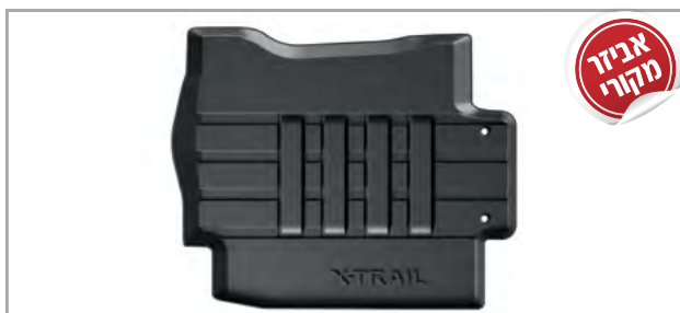
שטיחי גומי מק"ט: LP00021604