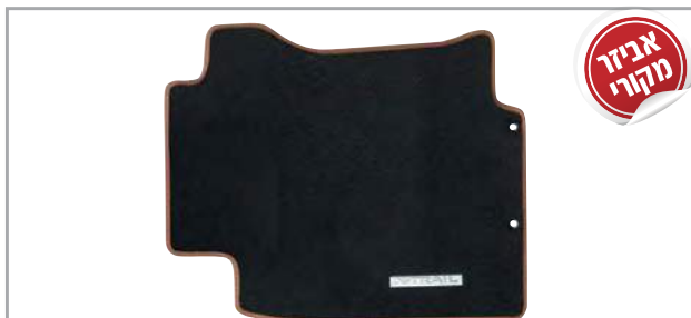
שטיחי לבד מהודרים בגימור חום מק"ט: LP-00021905