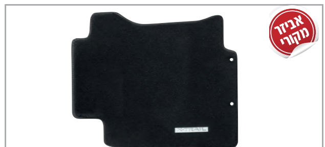
שטיחי לבד מהודרים בגימור שחור מק"ט: LP-00021906