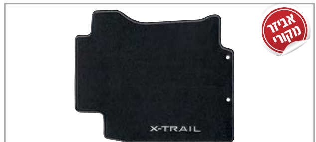
שטיחי לבד מהודרים מק"ט: LP00021904