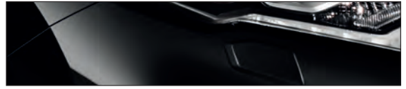
G41 שחור מטאלי