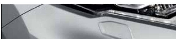
K23 כסף מטאלי