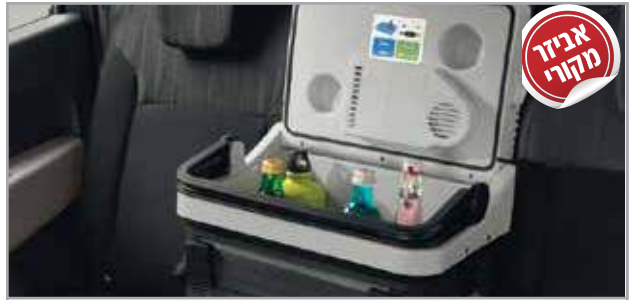
קירורית מק"ט: LP00011541