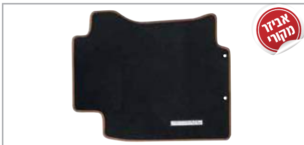
שטיחי לבד מהודרים בגימור חום מק"ט: LP-00021905