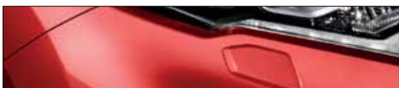
NBF אדום רובי מטאלי