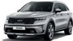
Silky Silver (4SS)