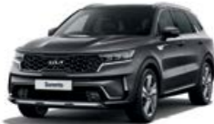
Platinum Graphite (ABT)