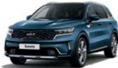
Mineral Blue (M4B)