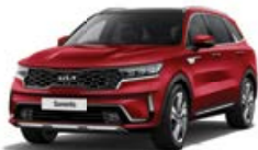
Runway Red (CR5)