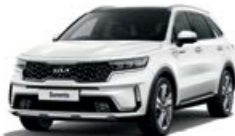
Snow Pearl White (SWP)