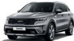
Steel Grey (KLG)